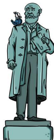
Am Selvedenkmal (ganz oben)

Zum „Stillen Gustav“ müsst Ihr gehn seht ihr ihn bald am Waldrand stehn? Er war ein reicher Fabrikant und für sein großes Herz bekannt Hier danken seine Mitarbeiter für Schulen, Wohnraum und so weiter, sein Lebensmotto steht im Stein. Was mag es wohl gewesen sein? 13. _ _ _ _ _