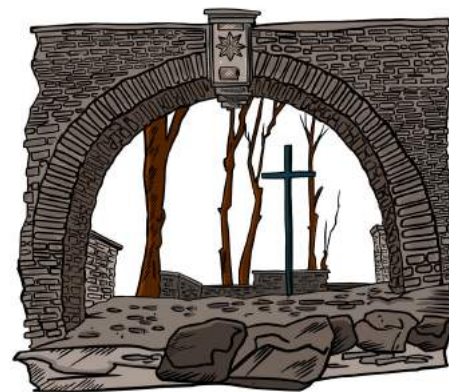
Fritz-Thomee-Str, oberhalb der Burg

Doch hoffentlich seid IHR entschieden und mit Nachdruck für den Frieden!